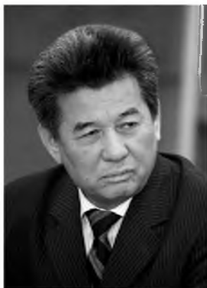
Академик НАН РК М.К.Койгелдиев

ности и сохранения территориальной целостности». 2