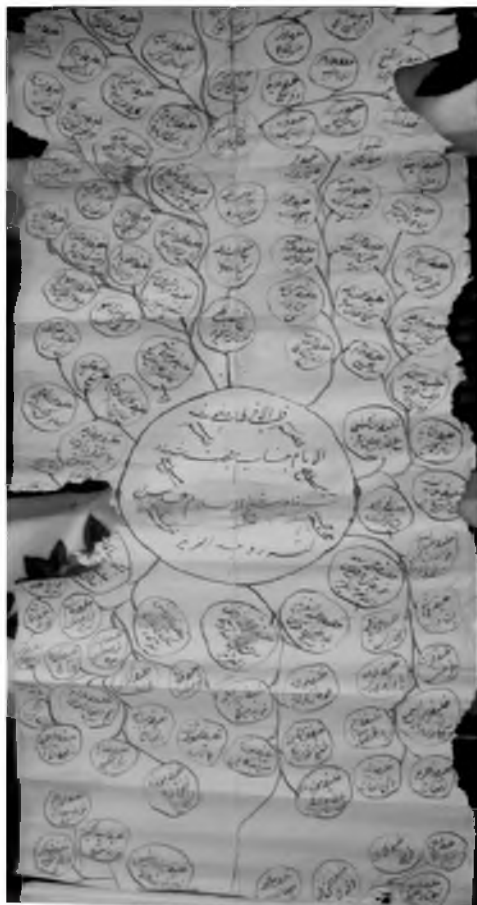
Мавлоно Атоуллох Хўқандий ҳасабномаси 1