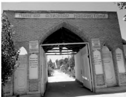
Зиёратгоҳнинг кириш дарвозаси