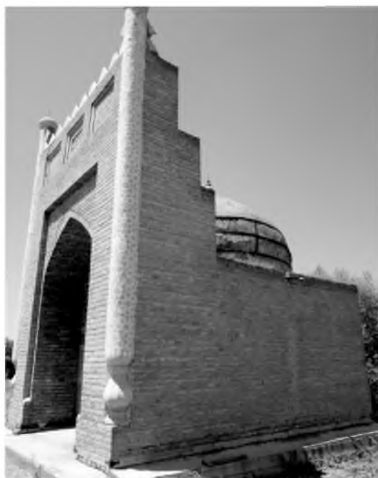
Шарқ томондан кўриниши