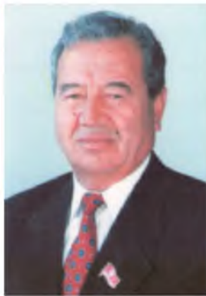
Таниқли давлат ва жамоат арбоби Бўрибой Жўраев