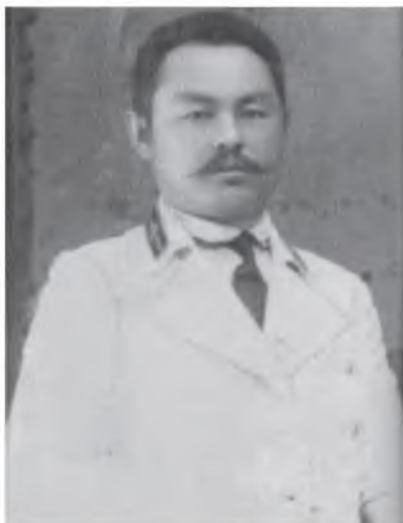
Муҳаммад-жон Тинишбоев (1879 – 1937), биринчи қозоқ муҳандиси-темирйўлчиси, Туркистон мухториятининг Бош вазири

Туркистон мухториятининг 100 йиллигини нишонлар эканмиз, бу мустақил ҳукуматнинг биринчи Бош вазири ва ички ишлар вазири Муҳаммад-жон Тинишбоевнинг ҳаёти ва тақдири қардош ўзбек ва қозоқ халқлари учун ниҳоятда қадрли ва аҳамиятлидир. Ўзбекистон тарихшунослигида, жумладан, Туркистон тарихи билан машҳур бўлган олим-