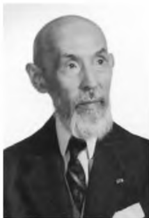
Исломбекнинг кексаликдаги сурати

эттирмоқдаман. Темурийлар даври тарихчилар, файласуфлар, иқтисодчилар, илоҳиётчилар ва ҳарбийлар учун ҳали-бери туганмас ва серзавқ бир мавзудир, зеро, Темурбек фаолияти мазкур соҳаларнинг барчасини кенг қамраб олган.