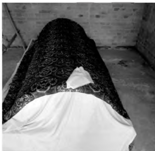
Мақбара ичкарасида жойлашган қабр