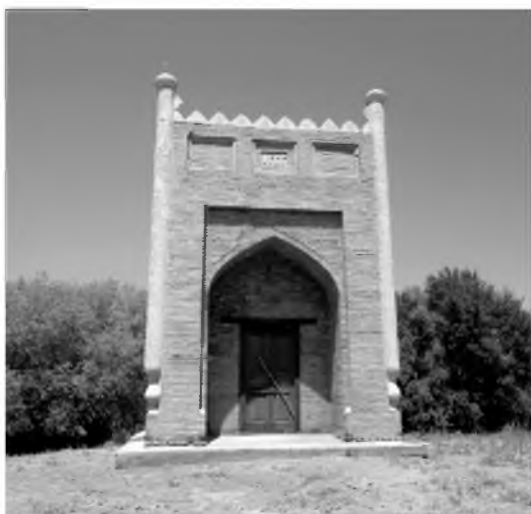
Олд томондан кўриниши