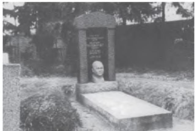
Мустафо Чўқаевнинг Берлиндаги қабри

Қадимий Берлин шаҳрининг озода ва осуда кўчаларидан бирида қабристон жойлашган. Уни «Турк-ислом қабристони» дейишади. Унга севимли ватани –Туркистон мустақиллиги йўлида курашмоқдан толмаган, ўз ватандошларига қўлидан келган яхшилигини аямаган бир муборак зот – Мустафо бей Чўқаевнинг жасади ҳам қўйилган. Ҳатто унинг вафоти ҳам юртига, ватандошларига муҳаббатидан нишона бўлди. 1941 йилда фашистлар Совет Иттифоқига ҳужум бошлади. Урушнинг бошларидаёқ юз минглаб совет кишилари фашистлар томонидан асир олинди. Бу кезларда Мустафо Чўқай Парижда яшарди. Фашистлар уни зудлик билан Берлинга олиб келишади ва асир тушган туркистонликлардан ҳарбий қисмлар тузишни талаб қилишади. Мустафо Чўқай бу таклифни қатъиян рад этади, бироқ асирликдаги юртдошлари билан кўришиб, қандайдир йўллар билан уларнинг қисматини енгиллатишга ёрдам беради. Шу учрашувларда у сил касалини юқтириб олади. Касал зўрайиб, 1941 йилнинг 27 декабрида Мустафо Чўқаев оламдан кўз юмади.