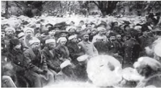
Туркистон муваққат ҳукумати аъзолари Қўқон шаҳридаги йиғинда

таркибида бирон-бир ўзбек, туркман, қозоқ, киргиз, тожик бўлмаганидан (ваҳоланки, шу съездда 50 нафарга яқин маҳаллий миллат вакиллари қатнашганди) хижолат тортган. Туркистон ўлкасидаги ҳам қонун чиқарувчи, ҳам ижро этувчи бошқарув органи – Туркистон ўлка халқ комиссарлари совети бўлиб, унинг раиси давлат ва ҳукумати бошлиғи сифатида 26 ёшли большевик Ф.Колесов сайланган. 1918 – 1920 йилларда Туркистон компартияси Марказий Комитетида И.О.Тоболин, А.Ф.Солькин, П.А.Кобозев, Марказий Ижроия Комитети раиси лавозимида П.А.Кобозев, В.Д.Вотинцев, А.А.Казаков, И.А.Апин, Халқ Комиссарлари Советида Ф.И.Колесов, В.Д.Фигельский, И.Е.Любимов, Я.Э.Рудзутак фаолият олиб борганлар. Бутун Фаргона водийсида совет ҳокимиятига большевик П.Д.Крутиков, Андижон уезди советига большевик Д.С.Урюпин, Қўқон уезди советига большевик Е.А.Бабушкин, Наманган уезди советига большевик С.Г.Дадасянц раҳбар этиб тайинланди. Ўлканинг Сирдарё, Самарқанд, Каспийорти, Етгисув вилоятларида ҳам худди шундай аҳвол эди. Туркистондаги совет бошқарув тизимидаги давлат раҳбар органи таркибига маҳаллий миллат вакиллари мутлақо яқинлаштирилмади.