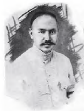
Маҳмудбек Қозиев (1890 – 1937)

Андижон тараққий-парварларидан Маҳмудбек Қозиев Туркистон мухториятига моддий ёрдам бериш ва маблағ тўплаш бўйича газначилик қилган. Мухтор ҳукуматнинг «миллий аскар» (миллий гвардия) ташкил этиш учун Маҳмудбек Қозиев Андижон уезди бўйича аҳолидан тўпланган маблағни Қўқонга олиб бориб мухториятчиларга топширган.