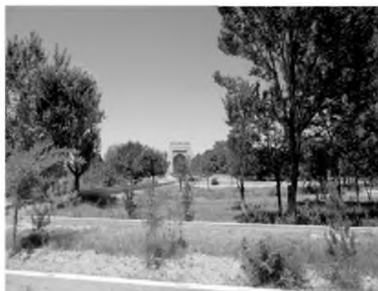
Зиёратгоҳ ҳовлиси ва узоқдан кўриниши