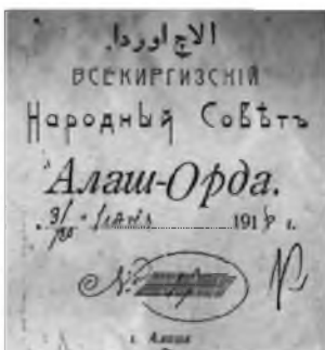
Алашўрда ҳукуматининг штампи

Қўйилган вазифаларни амалга ошириш учун жамият жамоат олдидан оммавий маърузалар билан чиқишлар ташкил этиш, тарғиботчи ва ташвиқотчилар мактабини асослаш, рисолалар нашр этиш, газеталар чиқариш билан машғул бўлган. Шунингдек, жамият ўз нашрига эга бўлиш учун Тошкентда чиқаётган «Бирлик туи» газетасида махсус бўлим очиш учун ҳаракат қилган.