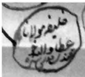
Силсилада «Халифа Мавлоно Атоуллох Хўқандий куддиси сир-руҳ» деб келтирилган