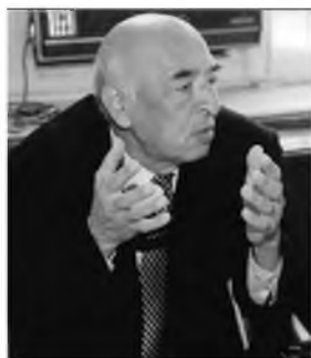
Озод Шарафиддинов (1929 – 2005)

Қуйида таниқли адабиётшунос олим, танқидчи, профессор, «Жаҳон адабиёти» журнаlining собиқ бош муҳаррири, Ўзбекистон Қаҳрамони Озод Обидович Шарафиддиновнинг «Мустафо Чўқай» номли катта мақоласидан айрим лавҳалар келтирилмоқда: ...Мазкур иш