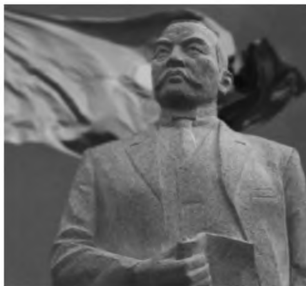
Алим Букейханга Семей (Семипалатинск) шаҳрида қўйилган ёдгорлик

«Гражданлар уруши даврида дарҳол Алаш мухторияти тўғрисида эълон қилиш имконияти йўқ эди. Шунга қарамай, 1917 – 1920 йилларда Алашўрда ҳукумати деюре-дефакто мақомида фаолият кўрсатган эди. Алашўрда мухторият