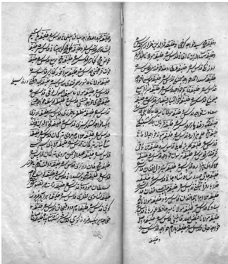
Мирзо Жунайдуллох Ҳозик. Куллиёт. 4 6 – 5 а -варағида Атоуллох Хўқандий номи келтирилган