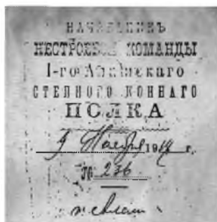
Алаш чўл отлик полки штампи

ошириш учун «Элётӣ» номи остида жамият ташкил этиш зарурлиги кўрсатилган. Шу заҳотиёқ бўлажак жамиятнинг мақсад ва вазифалари билан мажлис аҳли таништирилади. Бу мажлис бир овоздан «Элётӣ» жамияти тузишга қарор қилади. Бу жамиятнинг мақсади белгилаб берилади: 1) Фарғона области кўчманчиларини Россиядаги янги давлат гоёлари билан таништириш; 2) Уларни Таъсис мажлисига тайёрлаш; 3) Янги ижтимоий ва сиёсий тузумга таянчлар яратиш учун ижтимоий кучларни ташкил этиш; 4) Кўчманчилар орасида ҳуқуқий тартибни жорий этиш; 5) қозоқлар, қипчоқлар ва қирғизларни бирлаштириш гоёсини тарғиб этиш, ўзларининг сиёсий-миллий-иқтисодий манфаатларини биргаликда ҳимоя қилиш учун кураш олиб бориш.