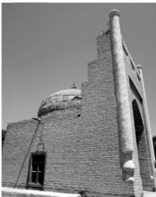
Ғарб томондан кўриниши