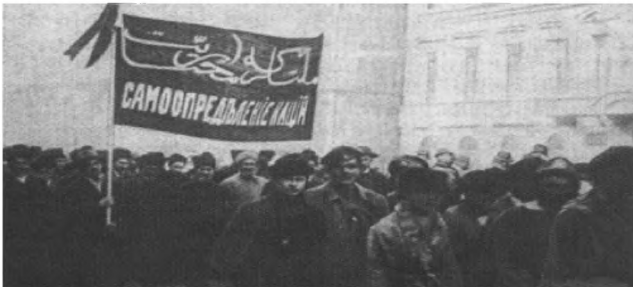
Петроградда Темир, Уилк, Иргиз, Жимпетинск, Кустанай ва Еттисув қозоқларининг намойиши. Олдинда байроқ кўтариб турган Мирёкуб Дулатов, байроқда рус ва араб имлосида «миллатлар ўз тақдирини ўзлари белгилашлари керак» деган ёзув

ошириш учун «Элётӣ» номи остида жамият ташкил этиш зарурлиги кўрсатилган. Шу заҳотиёқ бўлажак жамиятнинг мақсад ва вазифалари билан мажлис аҳли таништирилади. Бу мажлис бир овоздан «Элётӣ» жамияти тузишга қарор қилади. Бу жамиятнинг мақсади белгилаб берилади: 1) Фарғона области кўчманчиларини Россиядаги янги давлат гоёлари билан таништириш; 2) Уларни Таъсис мажлисига тайёрлаш; 3) Янги ижтимоий ва сиёсий тузумга таянчлар яратиш учун ижтимоий кучларни ташкил этиш; 4) Кўчманчилар орасида ҳуқуқий тартибни жорий этиш; 5) қозоқлар, қипчоқлар ва қирғизларни бирлаштириш гоёсини тарғиб этиш, ўзларининг сиёсий-миллий-иқтисодий манфаатларини биргаликда ҳимоя қилиш учун кураш олиб бориш.